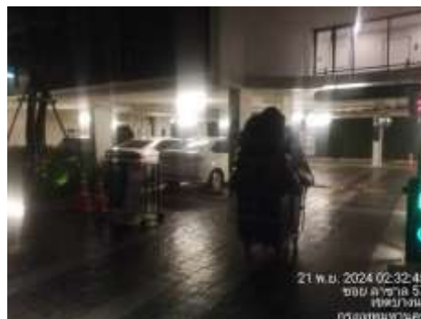
รูปที่ 8 รถขยะเข้ามาเก็บขยะมูลฝอยภายในโครงการ