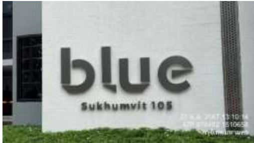
รูปที่ 33 ป้ายชื่อโครงการ