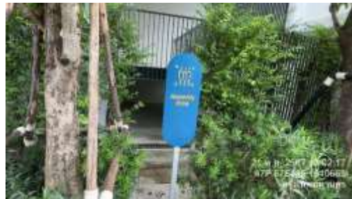
รูปที่ 16 จุดรวมพล