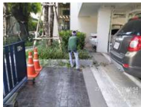
รูปที่ 2 เจ้าหน้าที่ดูแลพื้นที่สีเขียว