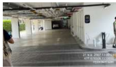
รูปที่ 4 ป้ายบอกเส้นทางการจราจรภายในโครงการ