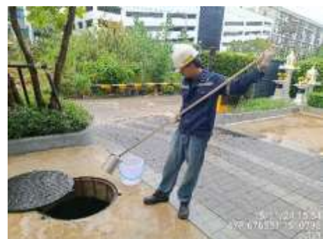
รูปที่ 5 เจ้าหน้าที่ตรวจสอบคุณภาพน้ำ