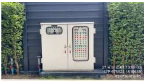
รูปที่ 35 มิเตอร์น้ำเสีย