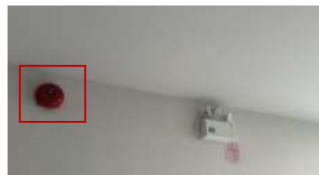
รูปที่ 11 ระบบแจ้งเตือนอัคคีภัย