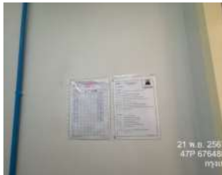
รูปที่ 9 ห้องพักขยะและท่อรวบรวมน้ำเสีย