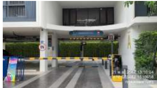
รูปที่ 34 ไม้กั้นทางเข้า-ออกโครงการ