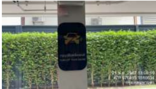
รูปที่ 29 ป้ายกรุณาดับเครื่องยนต์