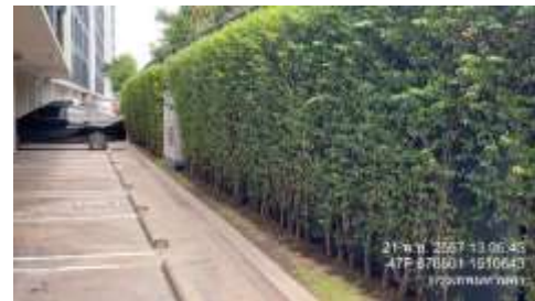
รูปที่ 1 พื้นที่สีเขียว