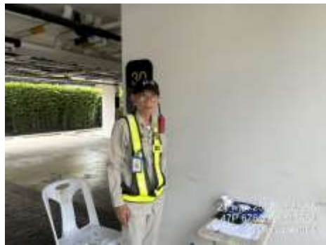
รูปที่ 6 เจ้าหน้าที่รักษาความปลอดภัย