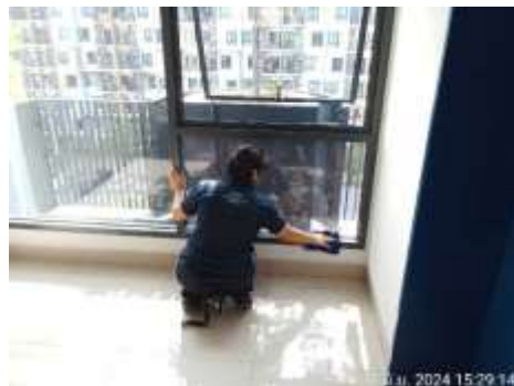
รูปที่ 3 พนักงานทำความสะอาดภายในโครงการ