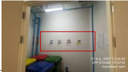
รูปที่ 15 ป้ายรณรงค์การแยกขยะ