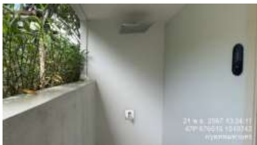
รูปที่ 25 พื้นที่สำหรับชำระร่างกาย