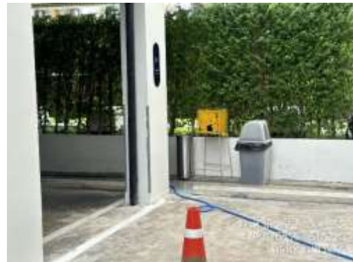
รูปที่ 26 พื้นที่สูบบุหรี่