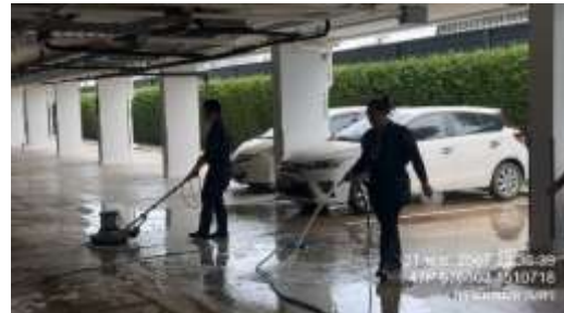
รูปที่ 31 เจ้าหน้าที่ทำความสะอาดพื้นถนนภายในโครงการ