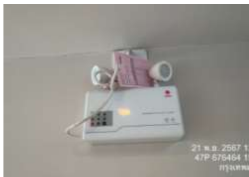
รูปที่ 14 ไฟฟ้าฉุกเฉิน