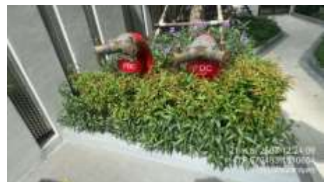
รูปที่ 7 หักรับน้ำดับเพลิง