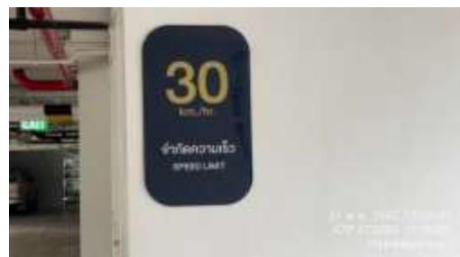
รูปที่ 28 ป้ายจำกัดความเร็ว