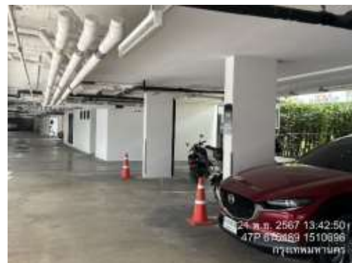
รูปที่ 32 พื้นที่จอดรถภายในโครงการ