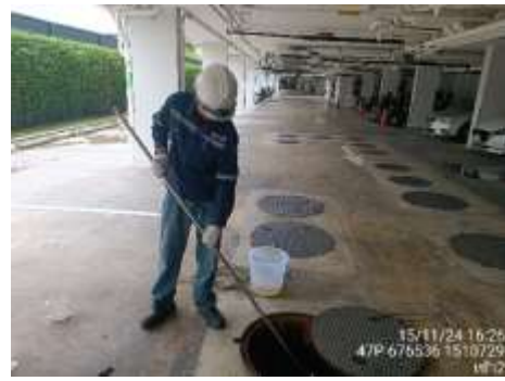
รูปที่ 5 เจ้าหน้าที่ตรวจสอบคุณภาพน้ำ (ต่อ)