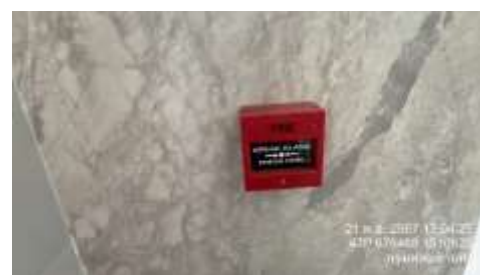
รูปที่ 10 ระบบป้องกันอัคคีภัย