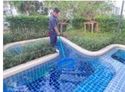
รูปที่ 24 เจ้าหน้าที่ทำความสะอาดสระว่ายน้ำ