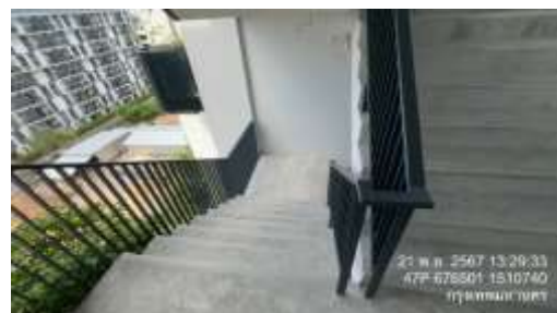
รูปที่ 13 บันไดหนีไฟ