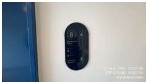
รูปที่ 12 แผนผังหนีไฟ