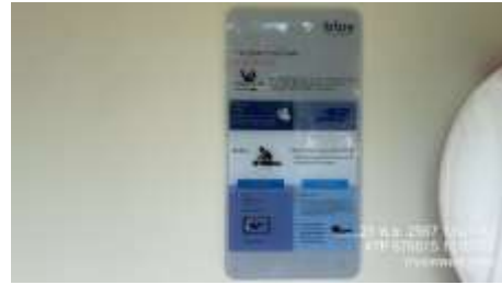
รูปที่ 23 อุปกรณ์ประจำสระว่ายน้ำและวิธีการช่วยชีวิตเมื่อมีคนจมน้ำ