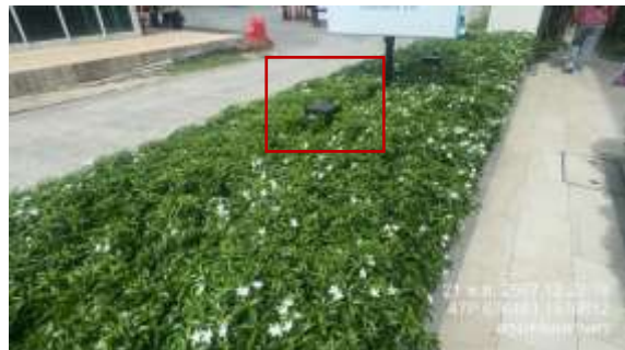
รูปที่ 38 ไฟส่องสว่างภายในโครงการ