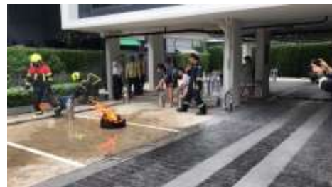
รูปที่ 41 ซ้อมดับเพลิง