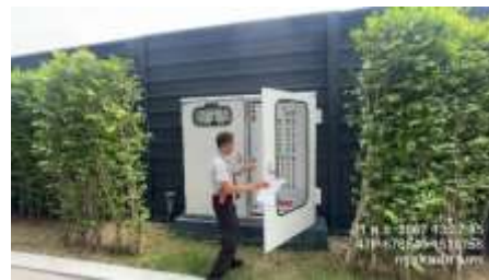
รูปที่ 30 เจ้าหน้าที่ดูแลระบบบำบัดน้ำเสียของโครงการ