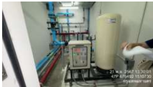
รูปที่ 17 เครื่องปั้มน้ำ