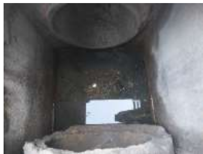
รูปที่ 40 ลอกท่อภายในโครงการ