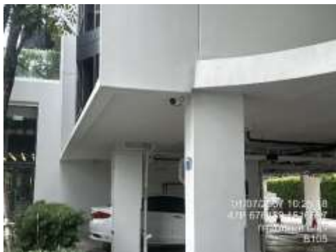
รูปที่ 27 กล้องวงจรปิด (cctv)