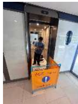
รูปที่ 39 ตรวจเช็คลิฟต์